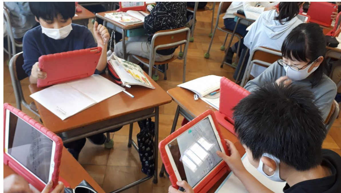
4年国語「プラタナスの木」