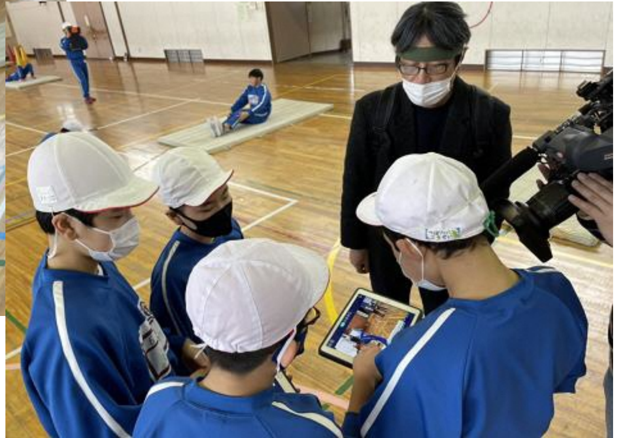
6年体育「マット運動」