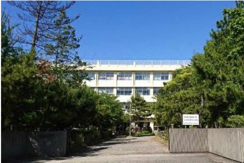
新潟市立東中野山小学校