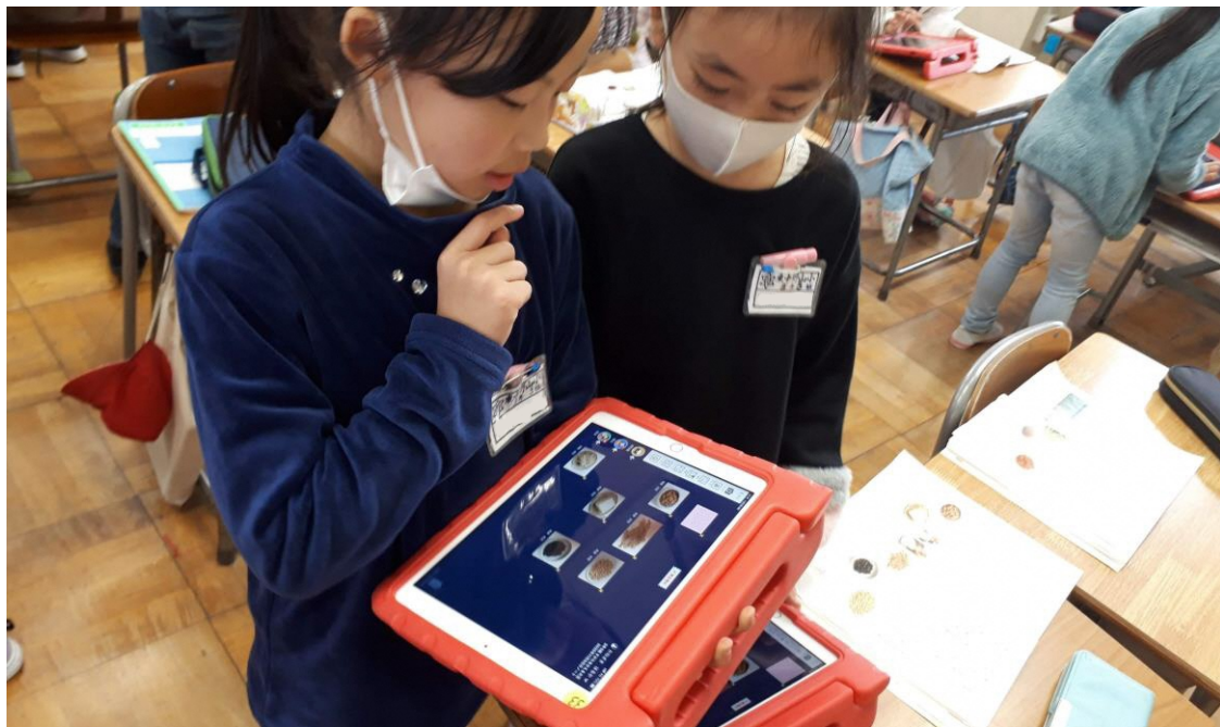
3年国語「すがたをかえる大豆」